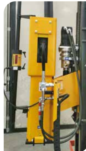
KIT LASER (Zubehör)