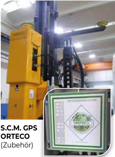
S.C.M. GPS ORTECO (Zubehör)