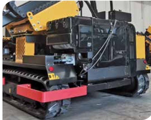
NEUE MOTOREN Neue wassergekühlte Dieselmotoren gemäß Stufe 5/Tier 4 Final mit Partikelfilter