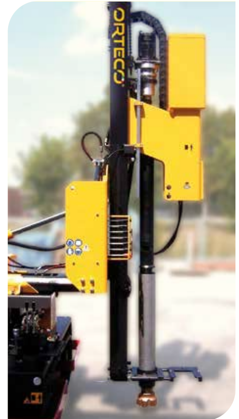
KIT MARTILLO FONDO HUECO (accesorio)

Nuevos motores diésel conformes según las normativas Stage 5/Tier 4 Final, con sistema de refrigeración líquida y provistos de filtro antipartículas (DPF).