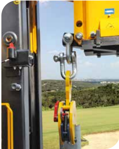
KIT EXTRACTOR (accesorio)