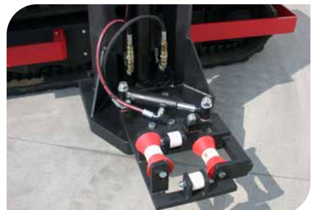
GUIDE INFÉRIEUR À ACTIONNEMENT HYDRAULIQUE AVEC ROULEAUX EN PLASTIQUE POUR PRÉSERVER LES SURFACES DES PIEUX EN BOIS (accessoire)