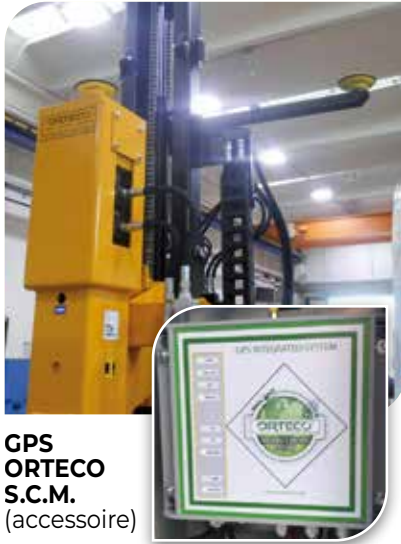
GPS ORTECO S.C.M. (accessoire)