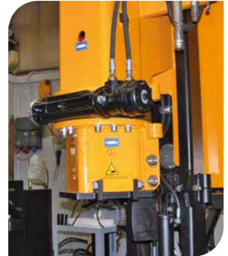
BOUCHE DE MARTEAU ROTATIVE POUR L'ORIENTATION DES PIEUX D'ANGLE CARRÉS (accessoire)

Nouveaux moteurs diesel conformes aux réglementations Stage 5/Tier 4 Final, refroidis à l'eau et équipés d'un filtre à particules