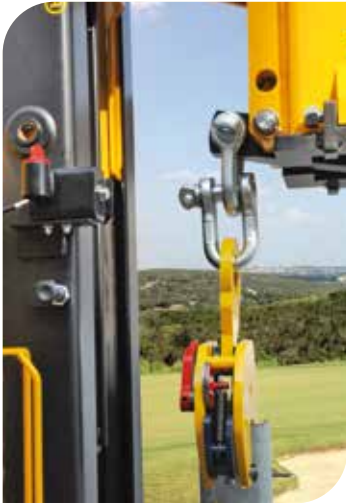
KIT EXTRACTEUR (accessoire)