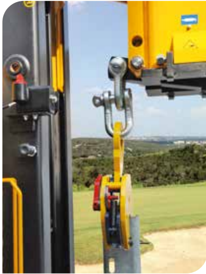
KIT AUSZIEHVORRICHTUNG (Zubehör)