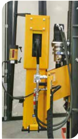
KIT LÁSER (accesorio)