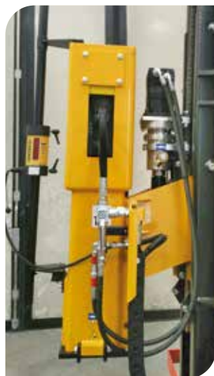
KIT LASER (accessorio)